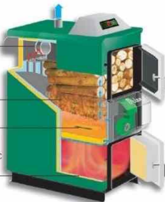
Принципиальная схема котла

Дожигание пламени и возврат теплоты темп. 1200°C