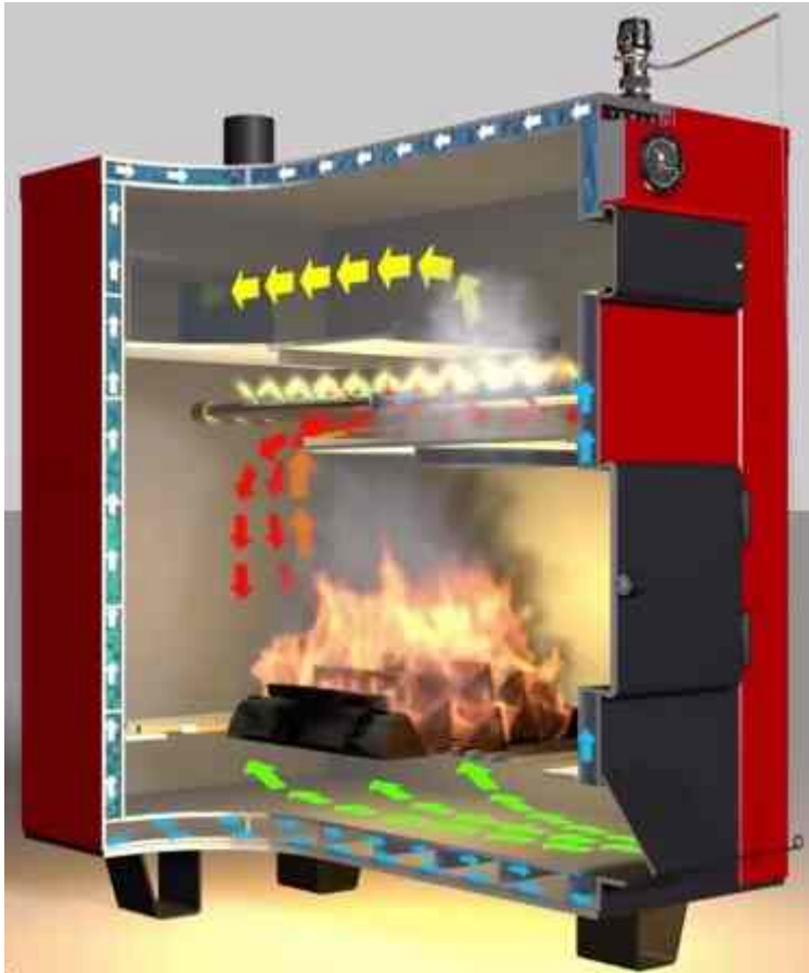
Пиролизный котел в разрезе

Сжигание топлива в классических твердотопливных котлах – это хорошая альтернатива применению для отопления дома традиционных энергоносителей, таких как природный газ или электричество. Но данные устройства не полностью используют энергию горения дров. При работе обычного котла выделяющийся при высокой температуре из топлива газ просто уходит наружу вместе с продуктами горения. Принцип работы пиролизного котла позволяет использовать этот газ, тем самым увеличивая КПД агрегата и длительность интервала между загрузками топлива. Такие аппараты еще называют газогенераторными.